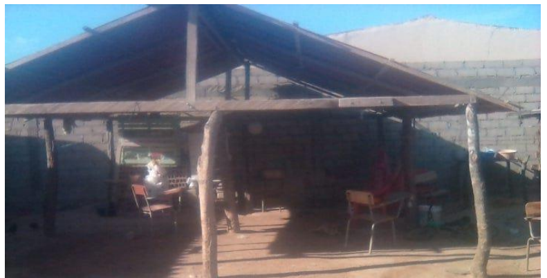
Antes - Ahora