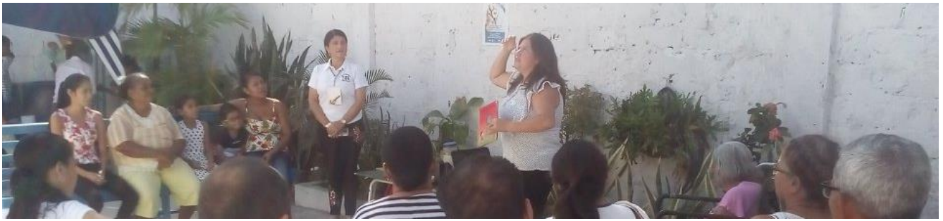
Cuentoterapia para mujeres, ¡PROTEGIÉNDONOS UNOS A OTROS! en el marco de una brigada de Salud. Soledad / Atlántico