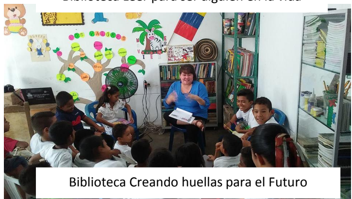
Biblioteca Creando huellas para el Futuro