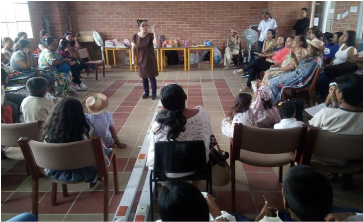
Entrenamiento a docentes, jóvenes y niños pupilos de oficiales de la Guajira, en técnicas de animación a la lectura.

Seguiremos impactado a La Guajira con nuestras formaciones voluntarias dirigida a mujeres, maestros, líderes sociales, jóvenes y niños para empoderarlos, enseñarles cómo trabajar temas de paz y reconciliación en sus escuelas, familias y comunidades, a través de la técnica que manejamos llamada Cuentoterapia, que usa el cuento como una estrategia de sanación y liberación, que permite encontrar salidas a las problemáticas y nuevas posibilidades. Todo esto gracias al apoyo de nuestros aliados desde el 2017, que se encargan de toda la logística: Hotel Waya Guajira (hospedaje y alimentación al equipo de voluntarios) y Jalaala Tours agencia de viaje (Traslado hasta los puntos más lejanos en la Guajira).