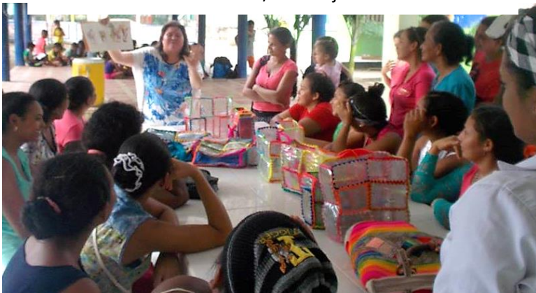
Taller de cuentoterapia sobre resiliencia y paz, dirigida a mujeres emprendedoras de los Montes de María (Sucre), sobrevivientes del conflicto armado