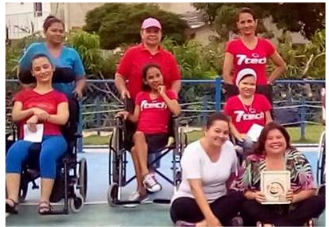
Lecturas para la inclusión, para mujeres con discapacidad motriz, sobre el manejo de sus emociones.