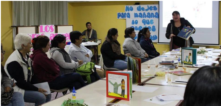
Taller para voluntarias lideresas sobre EL PODER DE LOS CUENTOS.

Ganadora de la Beca de circulación Internacional del Mincultura 2018