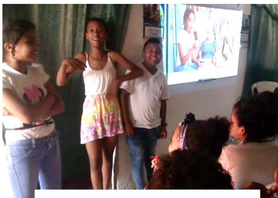
Biblioteca Lluvia de Imaginación

Son más de 300 niños, jóvenes y adultos los entrenados como Biblioperiodistas quienes publican en youtube las entrevistas, tutoriales y las historias de vida que realizan como actividad de campo: CANAL DE YOUTUBE: RED DE BIBLIOTECAS DE LIBROS LIBRES PARA TODOS.