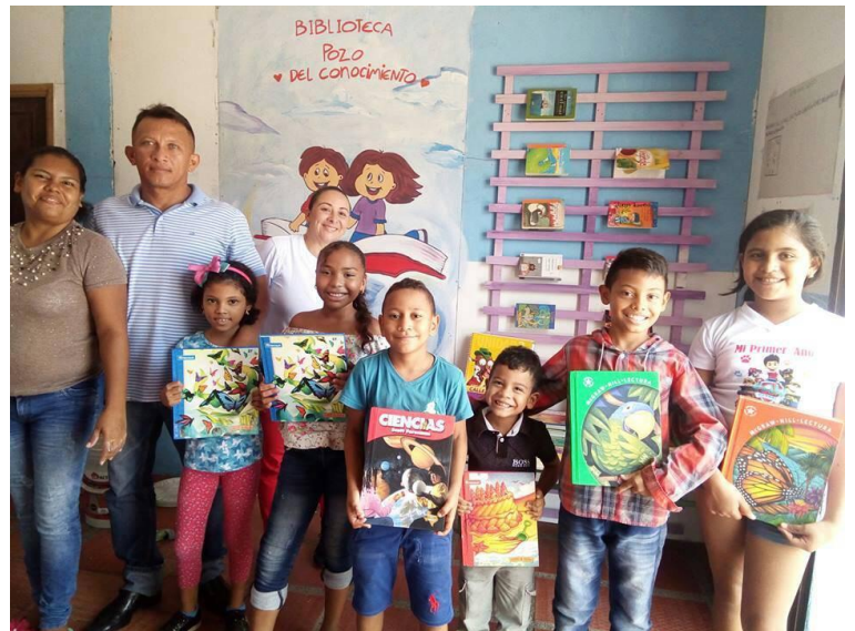
Donaciones de libros por parte de Children International