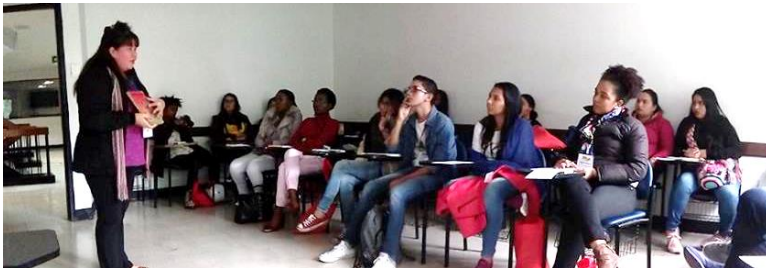
Formación sobre TRANSFORMACIÓN SOCIAL A TRAVÉS DEL VOLUNTARIADO, en el marco de convención anual de jóvenes líderes organizada por la Embajada de los Estados Unidos y Young Colombian Leaders 2018.