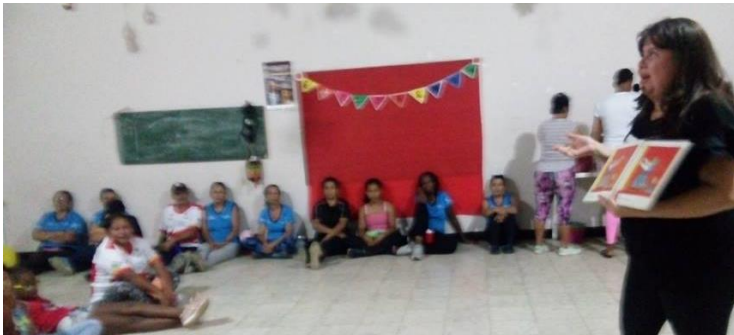
Taller de cuentoterapia, ¡NO SALGAS DE CASA! Para mujeres asistentes a actividades de gimnasia comunitaria.