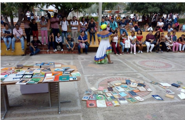
Evento de narración oral y Regalación de libros a jóvenes universitarios de la Universidad de la Guajira