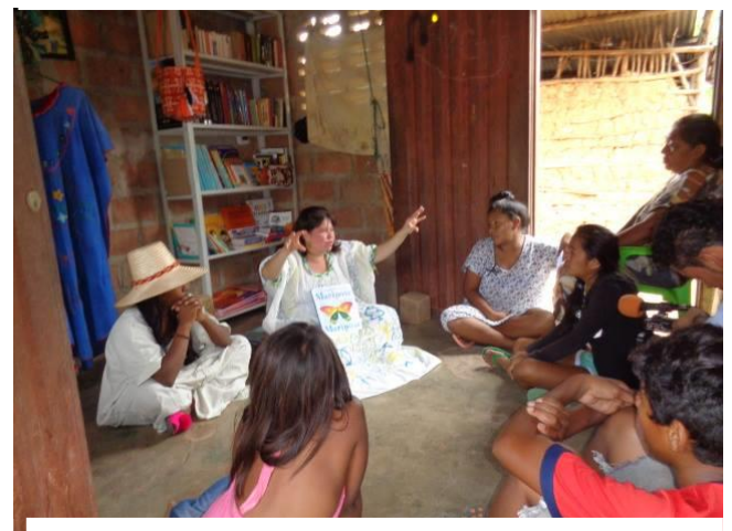
En 3 años en la Guajira como voluntarios, hemos hecho más de 40 talleres de animación a la lectura, 50 puntos de lectura, entrenado a más de 200 personas como mediadores de lectura y de paz y 2 Regalaciones de libros. Todo ha sido totalmente gratis y voluntario.