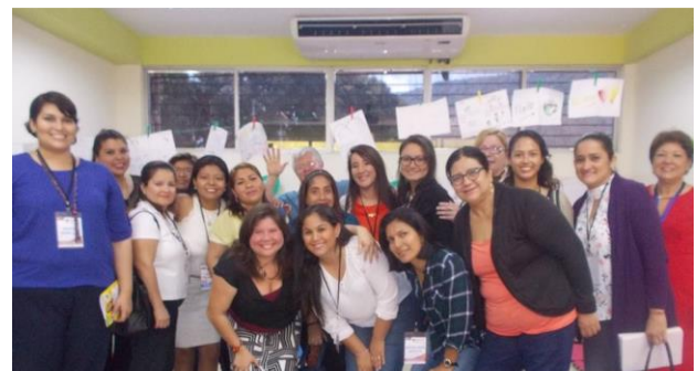
Taller de cuentoterapia para mujeres/maestras/promotoras de lectura en el marco de la I cita de la lengua y literatura. Guayaquil/ Ecuador.