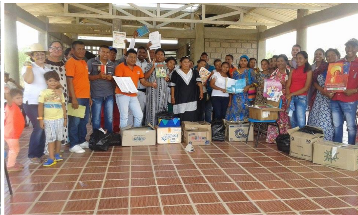
Dotación de cajas de libros a 25 escuelitas rurales étnicas de la Alta Guajira.