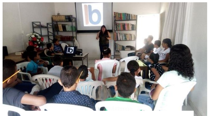
Biblioteca Leer para ser alguien en la vida