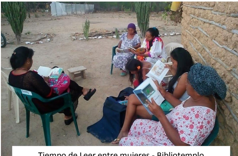
Tiempo de Leer entre mujeres - Bibliotempo Riohacha/ La Guajira

¡Todas las mujeres podemos ser lo que queramos ser y hacerlo muy bien.!