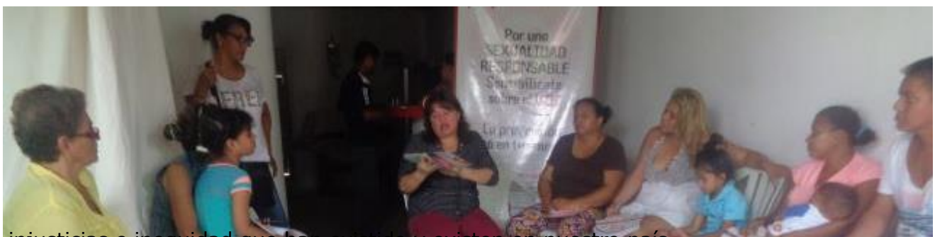
Cuentoterapia para mujeres, Sobre el autocuidado y amor propio en el marco de una brigada prevención del VIH y cáncer de mama. Barranquilla/ Colombia